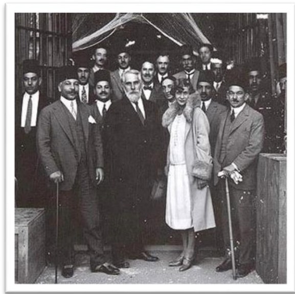
Au centre : P. Lacau, Howard Carter et Lady Carnarvon, devant le tombeau de Toutânkhamon, v.1924, Griffith Institute Oxford.

Alors que la course aux découvertes place l'archéologie égyptienne au cœur des revendications nationales des pays européens depuis le début du XIX ème , la période 1914-1922 marque un tournant dans l'histoire coloniale de l'Égypte : profitant du contexte de la Grande Guerre, le protectorat britannique se met officiellement en place, bien que l'occupation du pays dure en fait depuis 1882. Sa fin officielle en 1922 s'accompagne d'une montée du sentiment national à travers le pays, à laquelle l'égyptologie participe : l'affaire Toutânkhamon puis celle du buste de Néfertiti 6 enflamment le patriotisme d'une Égypte qui revendique de plus en plus son patrimoine propre face aux puissances coloniales. 7 Il s'agit alors d'interroger le rôle du Service des Antiquités, géré par un Français devant servir les