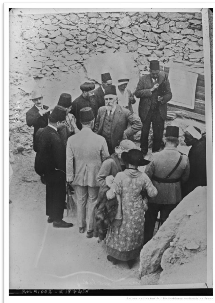
Pierre Lacau à l'entrée du tombeau de Toutânkhamon, 1924