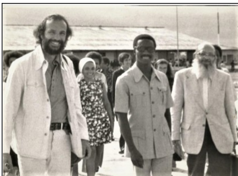
Arrivée de Paulo Freire et Claudius Ceccon en Guinée-Bissau, reçus par Mário Cabral, 1976

Freire et Ceccon fondèrent en 1971 avec l'écrivaine Rosiska Darcy de Oliveira et le diplomate Miguel Darcy de Oliveira l'Institut d'action culturelle (IDAC), afin de contribuer à la reconstruction d'une éducation démocratique de qualité dans les pays africains lusophones nouvellement indépendants. En introduction de l'ouvrage Vivendo e Aprendendo. Experiências do IDAC em educação popular publié en 1980, les quatre co-fondateurs évoquaient « une tentative de vivre et construire [...] une pédagogie de l'opprimé » dans divers contextes européens et africains face au « constat critique de l'impraticabilité historique de penser, à court terme, à [leur] réinsertion au Brésil 5 ». Mário Cabral, nouveau Ministre de l'Éducation de Guinée-Bissau, les invita en septembre 1975 à contribuer à son Programme national d'alphabétisation. Afin d'inscrire son action dans la réalité du terrain, l'équipe de l'IDAC parcourut plusieurs régions marquées dès 1963 par la guerre de libération et visita d'anciennes « zones libres », véritables laboratoires de la déconstruction du système colonial par le Parti africain pour l'indépendance de la Guinée et du Cap-Vert (SILVA, 2006). En sa qualité de dessinateur de presse, Claudius fut chargé de la réalisation de supports didactiques destinés à être projetés facilement sous forme de diapositives et ainsi largement diffusés.